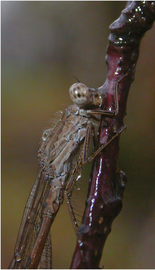
Figuur 4 Noordse winterjuffer ( Sympecma paedisca ) (♂) bedekt met gesmolten rijp (ijswater). Sympecma paedisca (♂) covered with icewater.

goede schutkleur. In herfst, winter en voorjaar is de kleur veranderd naar lichtbruin met bronskleurige donkere delen (MANGER, 2007); dieren op berkentakjes vallen dan nog nauwelijks op.